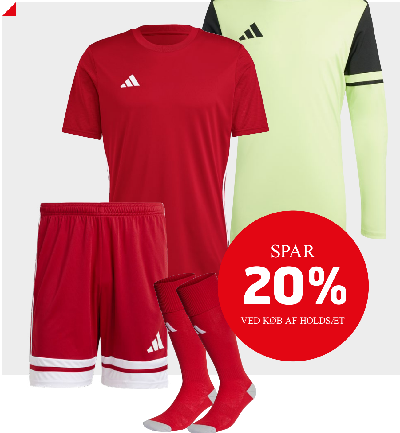
TABELA 23 JERSEY

# HT6552: Unisex XS-3XL # HS0540: Women XS-2XL